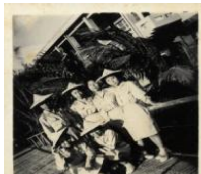
同學在「桂河大橋」留影