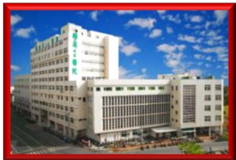
輔英科技大學附設醫院 屏東鄉親首選醫院 (屏東縣 東港鎮)