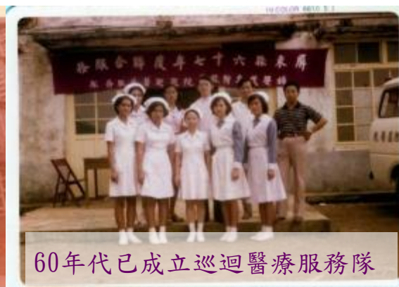
60年代已成立巡迴醫療服務隊