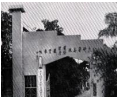
全國第一所私立助產學校