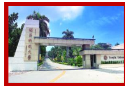
輔英科技大學 (高雄市 大寮區)